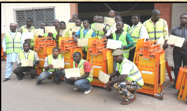
Remise des attestations aux apprenants Award of attestations to some trainees