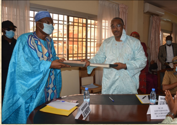
Signature de la convention de partenariat MINEFOP/MIPROMALO