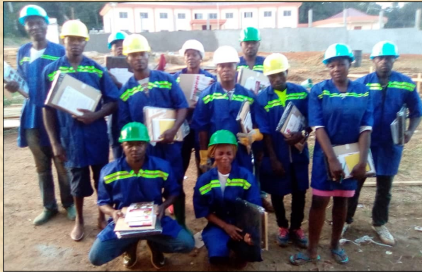
Formation jeunes de la localité de Ngomedzap aux techniques de la production et de mise en œuvre en matériaux locaux Training of youths of Ngomedzap on the techniques of production and use of local materials