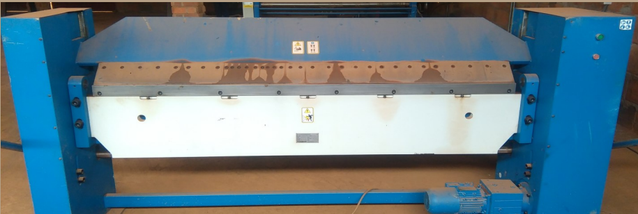
Plieuse motorisée pour des tôles d'acier de longueur max 2 m et d'épaisseur max 3 mm Motorised bender for steel plates of maximum length 2m and maximum thickness 3mm