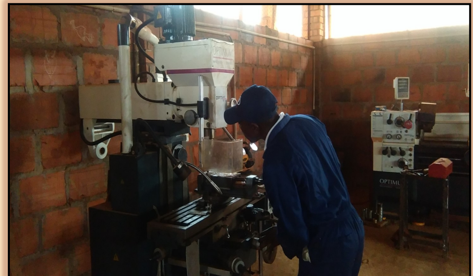
Fraiseuse automatique deux axes de puissance 4kW / High performance automatic two axes, 4kW Milling Machine