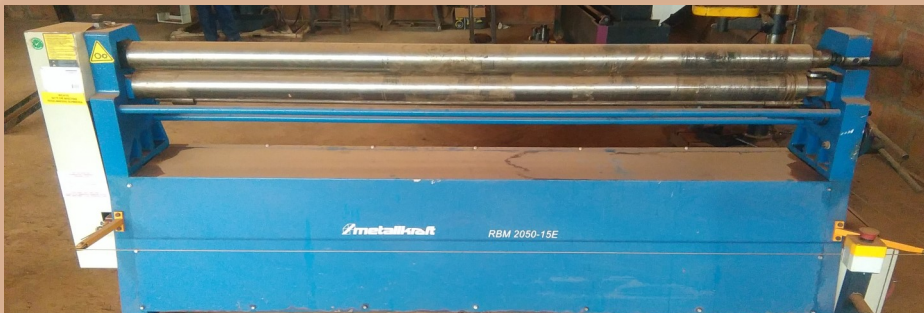
Rouleuse motorisée pour des tôles d'acier de longueur max 2m et d'épaisseur max 3mm Motorised folder for maximum of 3mm thick and 2m long steel plates 1500 W