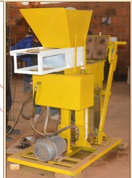
Hydraulic press for the production of CEB