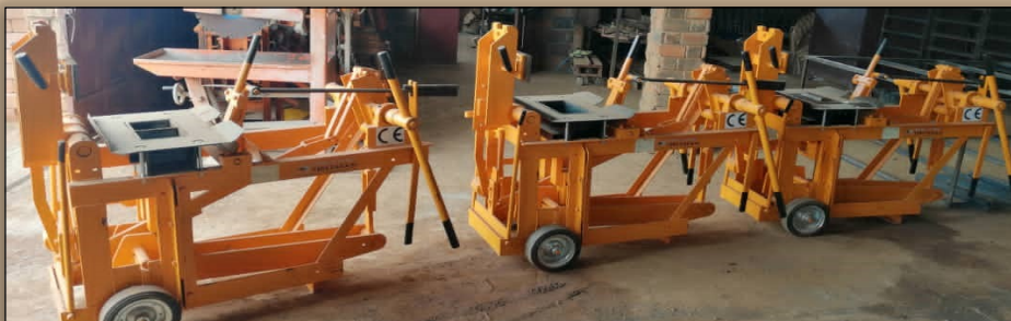
Presses Auram disponibles pour location et production des blocs de terre comprimée Auram press available for rental for the production of compressed earth blocks